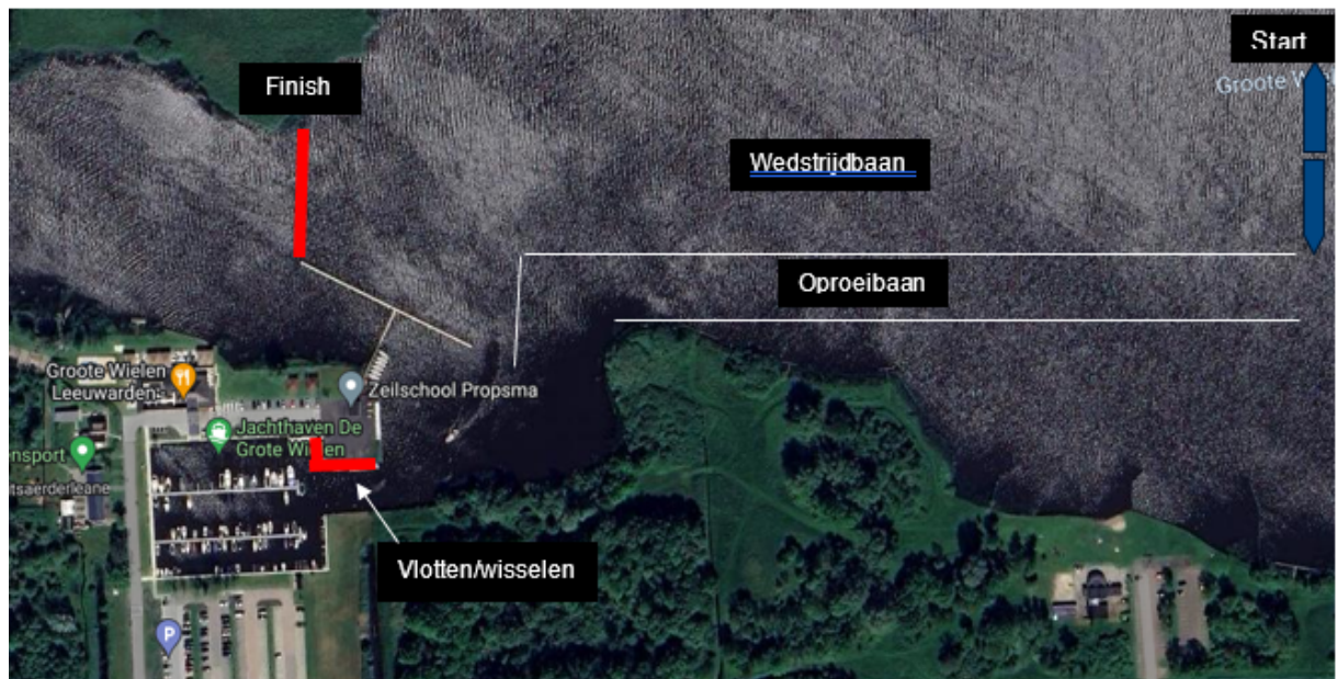
Afbeelding 3: Terugroeien/wisselen